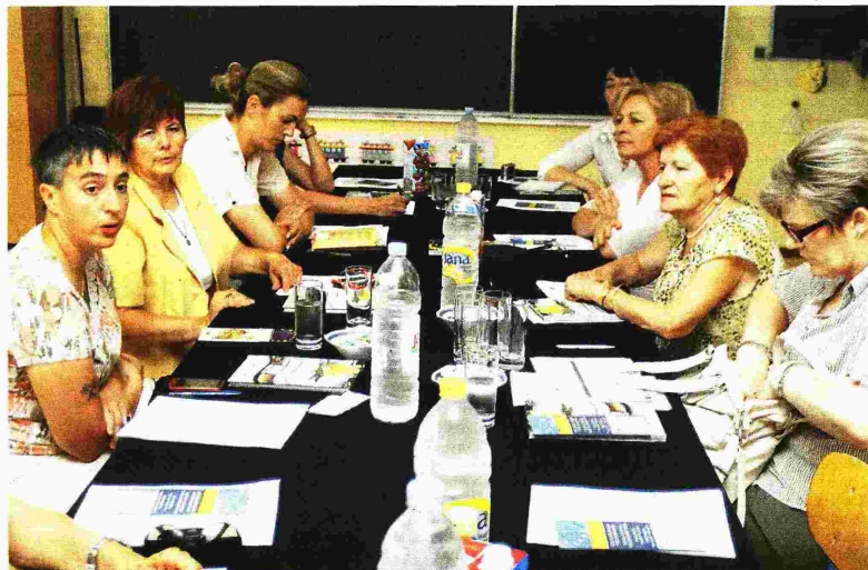
Projekt "Žene jugoistočne Europe u mreži za ruralni razvoj" jučer u Lišanima Ostrovičkim