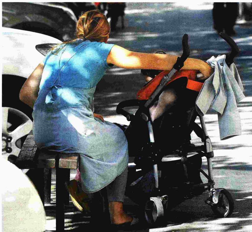
Nezapošljavanje majki problem je žena, ali i muškaraca – finansijski trpi cijela obitelj

je majka ne smije biti razlog ne samo bezobraznom ponašanju pojedinaca, već i diskriminaciji prilikom zapošljavanja. Slučaj pokazuje da je briga za djecu danas još uvijek prepuštena isključivo majkama, o čemu svjedoče i dostupni podaci koje sam objavila u svom izvješću o radu za 2011. Hrvatskom saboru, a koji pokazuje poražavajuću činjenicu da su trudnice i žene koje su nedavno rodile žrtve spolne diskriminacije od strane poslodavaca. O tome sam govorila na okruglim stolovima vezano uz predstavljanje projekta o razvoju žena u ruralnim sredinama, gdje sam naglašavala važnost dostupnosti javnih servisa –